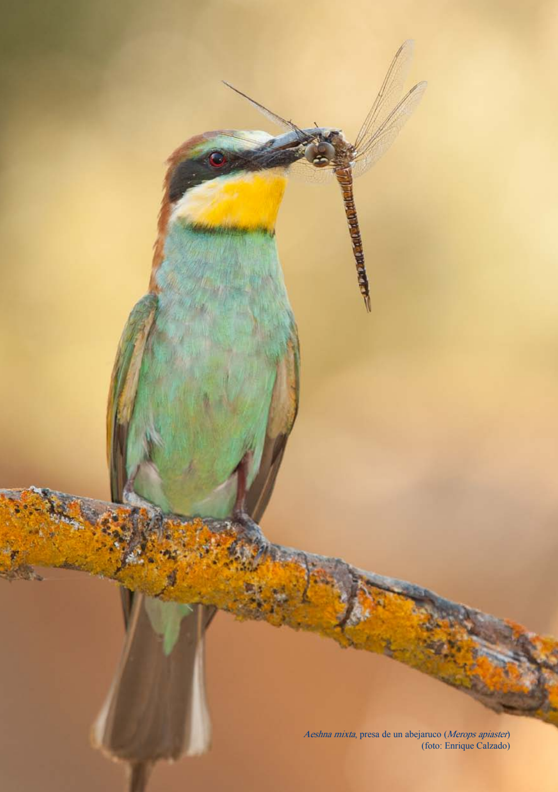
Aeshna mixta , presa de un abejaruco ( Merops apiaster )